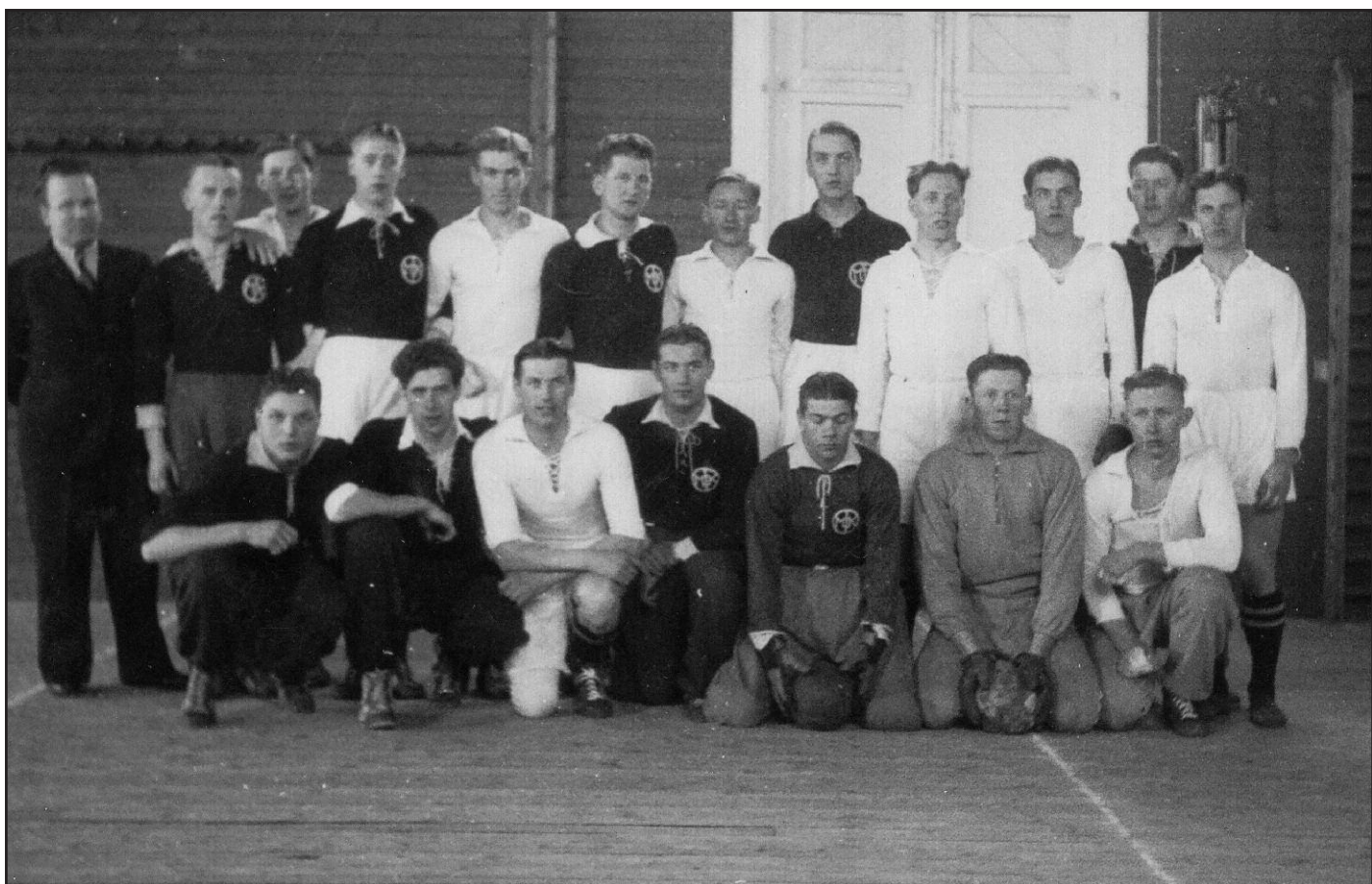
Ett SIS-lag i Lägerhyddan.