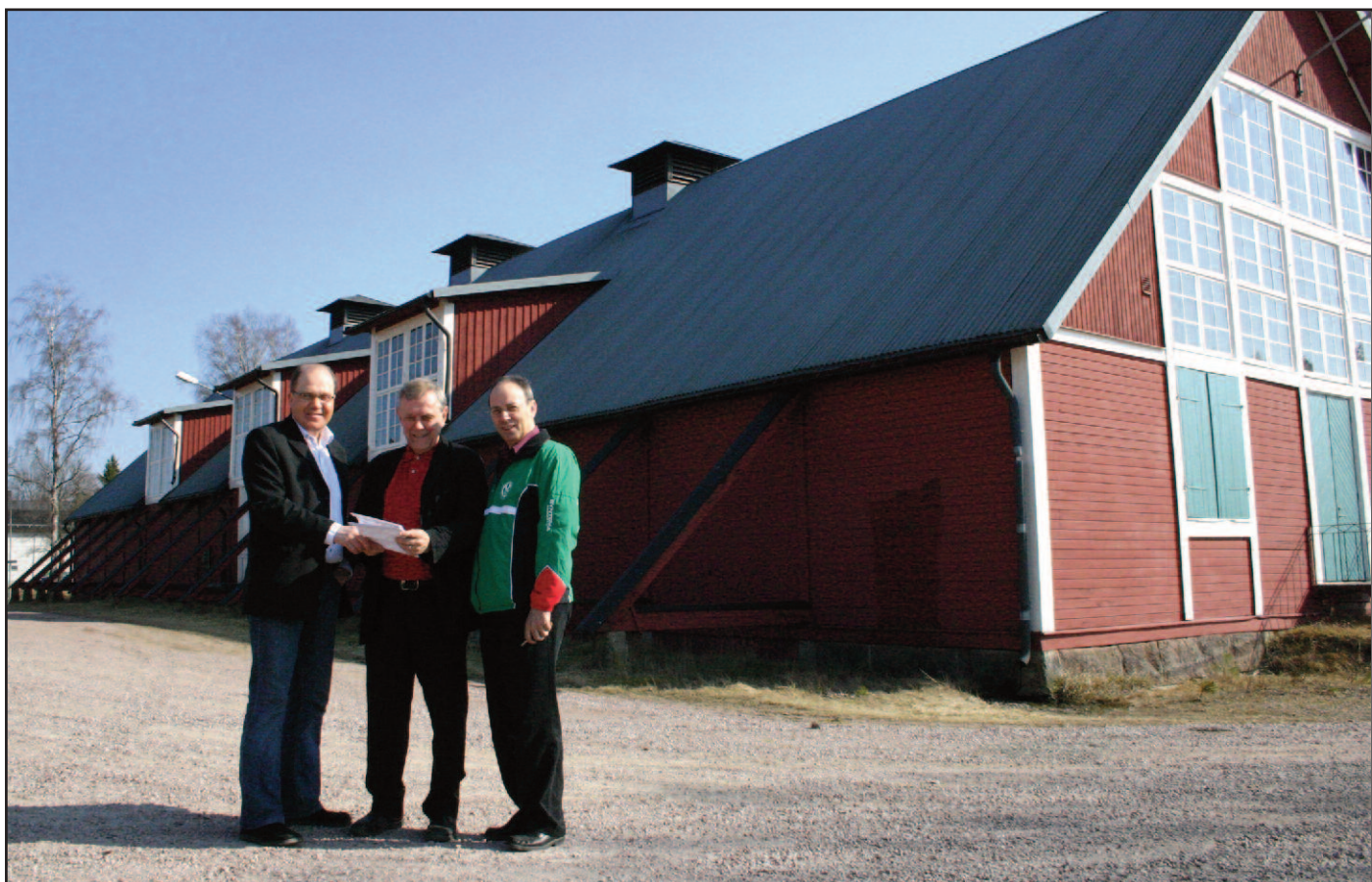
Inför O-Ringen 2005. Foto: Per Bunnstad

Ur Per Bunnstads vykortssamlingar. Fotograf okänd