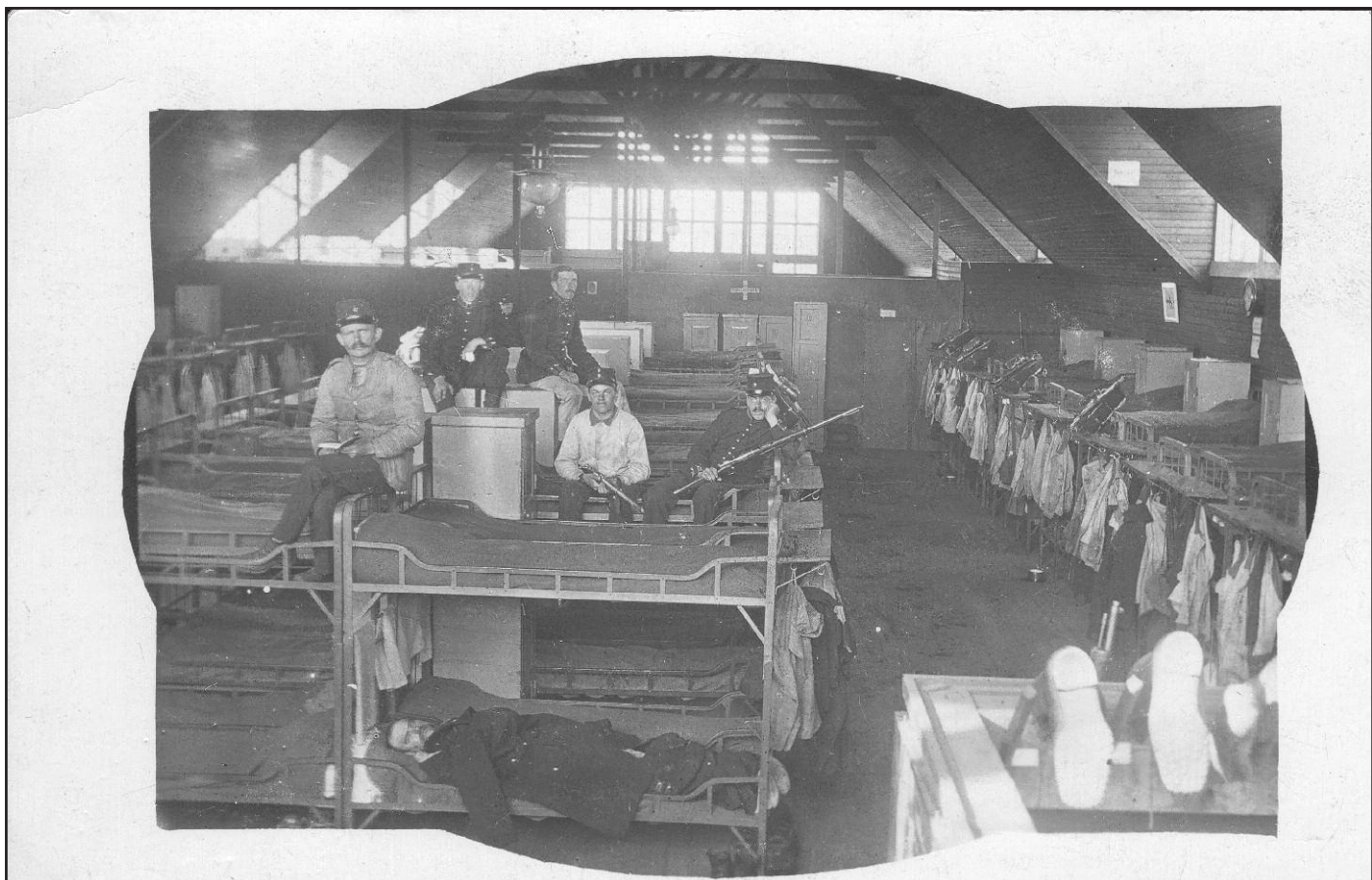
En interiör från Lägerhyddan, troligen kring 1920.

Ur Per Bunnstads vykortssamlingar. Fotograf okänd