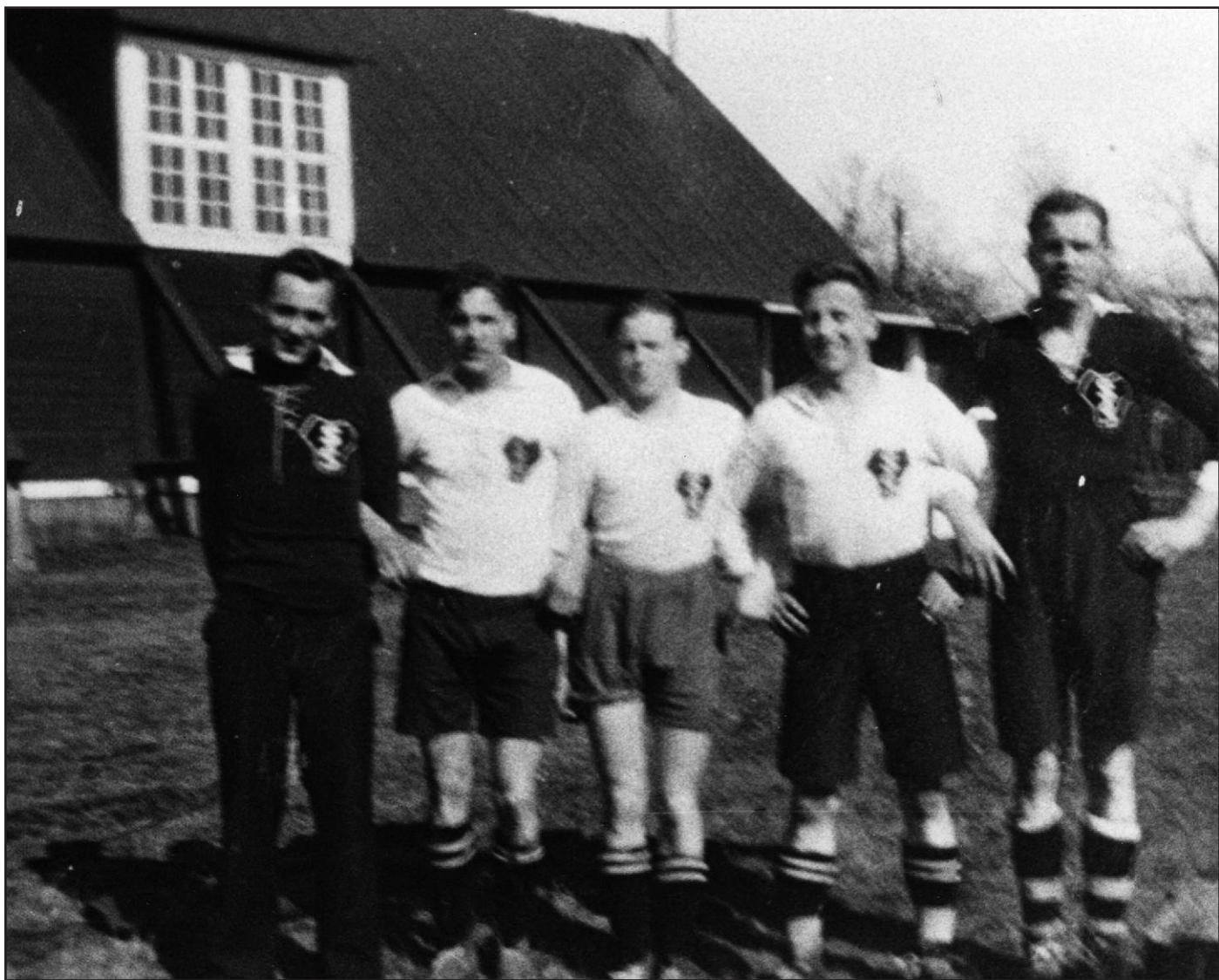
Några fotbollslirare från SIS utanför Lägerhyddan.