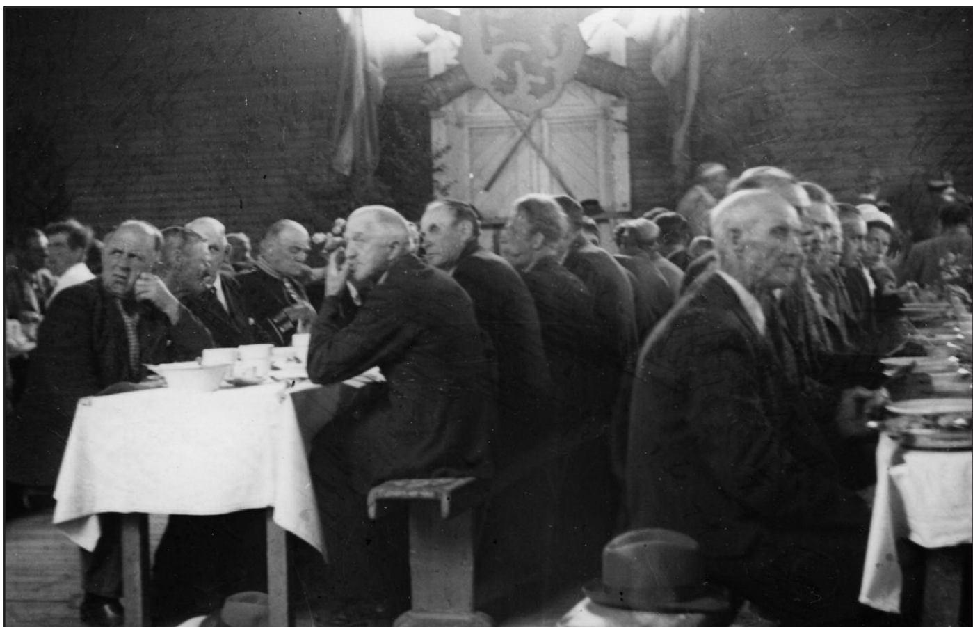
En SIS-fest i Lägerhyddan.